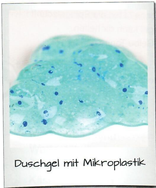
Duschgel mit Mikroplastik

Plastikteile, die kleiner als fünf Millimeter sind, nennt man Mikroplastik. Doch wie entsteht Mikroplastik und in welchen Produkten ist es enthalten? Mikroplastik entsteht zum Beispiel beim Autofahren. Durch den Druck und das Gewicht des Autos werden die Reifen auf der Straße abgerieben. Dabei lösen sich winzige Gummiteile. Diese gelangen dann durch Wind oder Regen in Abwasserkanäle oder Flüsse und werden ins Meer weitertransportiert.