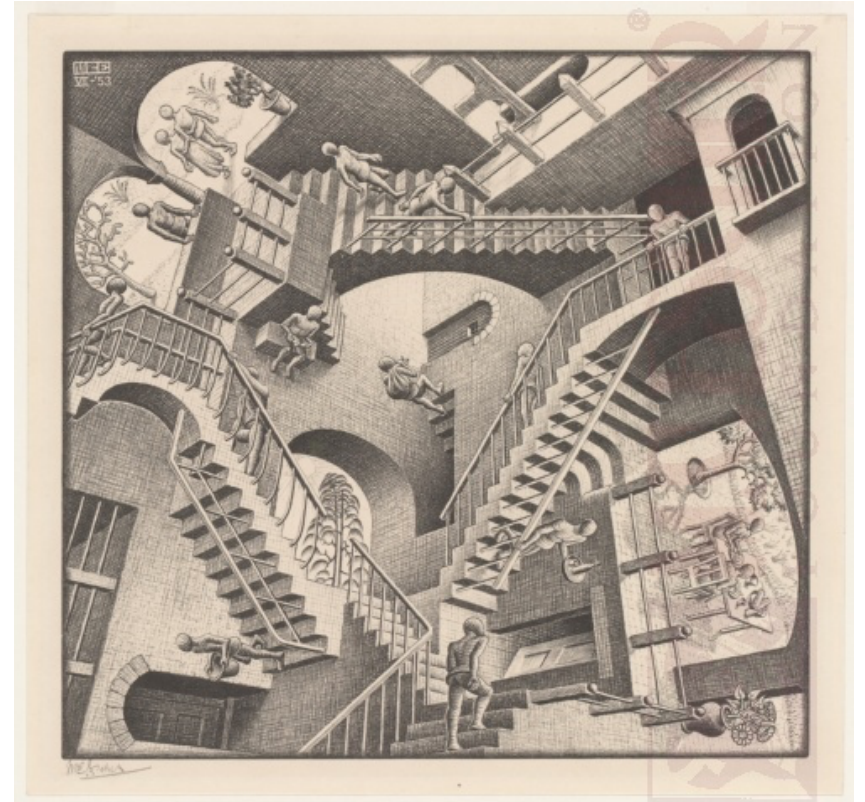
M.C. Escher, Relativity, 1953

https://mcescher.com/gallery/lithograph/