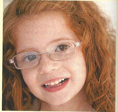
1 Brillen helfen bei Sehfehlern.

Bei der Kurzsichtigkeit werden weit entfernte Gegenstände nicht scharf gesehen. Ursache ist, dass der Augapfel etwas zu lang ist. Die Linse des Auges kann sich nicht stark genug verformen. So werden die Lichtstrahlen nicht an die