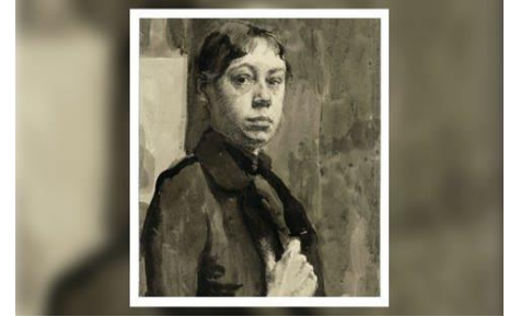
Die 22-jährige Käthe Kollwitz im Selbstportrait 1889